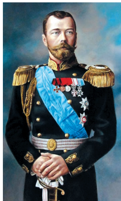
Основатель первого вуза Урала император Николай II

Актуальность специальностей для горной промышленности увеличивается с каждым годом. Причиной тому прогресс, охвативший весь современный мир. Ведь если полстолетия назад создание телефона требовало наличия всего лишь 9 видов минералов, то его сегодняшняя версия увеличила данный порог до 55 наименований. Подобная тен-