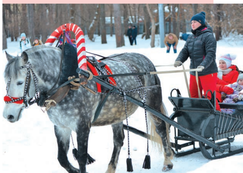
Для гостей праздника горняки организуют катание на лошадях

Какой горняк не любит русскую Масленицу , знаменующую окончание зимы! Ее любят все, а традиционные блины и забавы стали близки и студентам из Гвинеи, Монголии, Китая и многих других стран. Праздник Горный университет организует в парке «Зеленая Роща», куда приходят повеселиться и угоститься блинами жители Ленинского района.