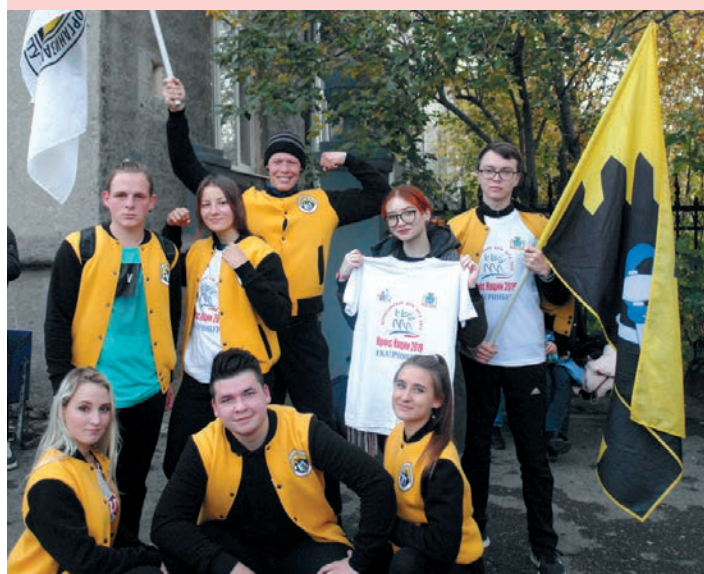
Студенты-горняки на «Кроссе нации»

В здоровом теле – здоровый дух, ни один «Кросс нации» не обходится без горняков. Не сотни – тысячи студентов каждый год дружно выходят на старт и бегут единой командой с флагами Горного и прекрасным настроением.