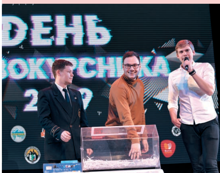
В День первокурсника проводится студенческая лотерея, где ребята выигрывают различные гаджеты

Год назад в Горном родилась новая традиция — отмечать начало занятий в первом вузе Урала увлекательным квестом. Университет был основан в 1914 году, а первые лекции для студентов начались три года спустя в октябре месяце. На праздничном столе участников квеста ждал сюрприз — фирменный 11-килограммовый торт.