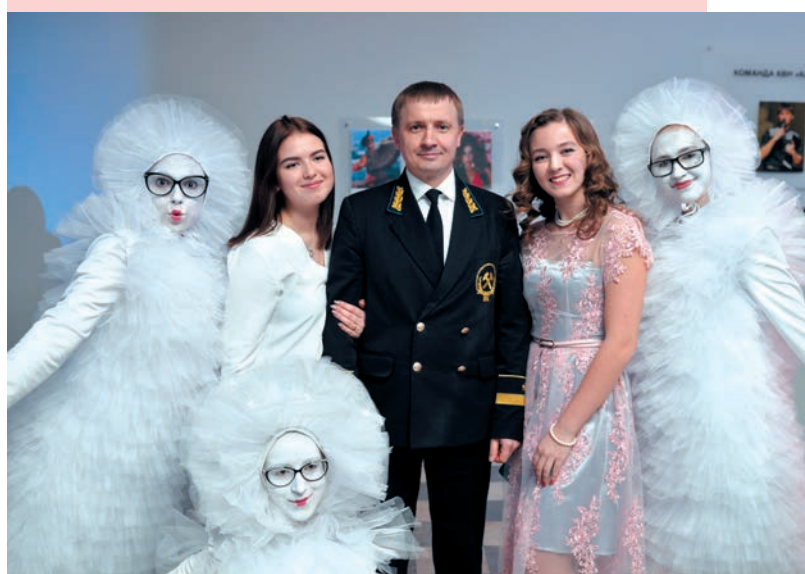
Новогодний корпоратив после Ректорского приема

В ноябре в университете проходит также самое веселое студенческое шоу — Открытый фестиваль команд КВН УрФО на Кубок УГГУ «Уральские горы юмора» . Его участники — лучшие команды со всей России, а главный приз — 100 тысяч рублей.