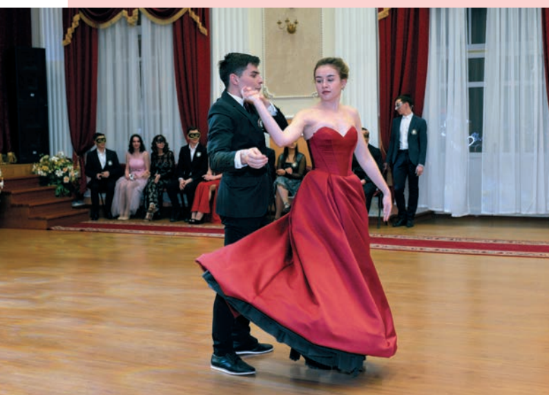
Участники новогоднего бала-маскарада

В преддверии Нового года в Горном университете проходит праздничный бал-маскарад, где участвуют более 100 танцоров. Изысканные платья, сложные прически, блеск украшений, строгие фраки и живая музыка – атмосфера официального светского торжества переносит студентов на несколько веков назад. Общие танцы перемежаются хореографическими номерами от каждого факультета. Помимо танцев участники маскарада развлекают себя бальными играми и услугами почтового салона.