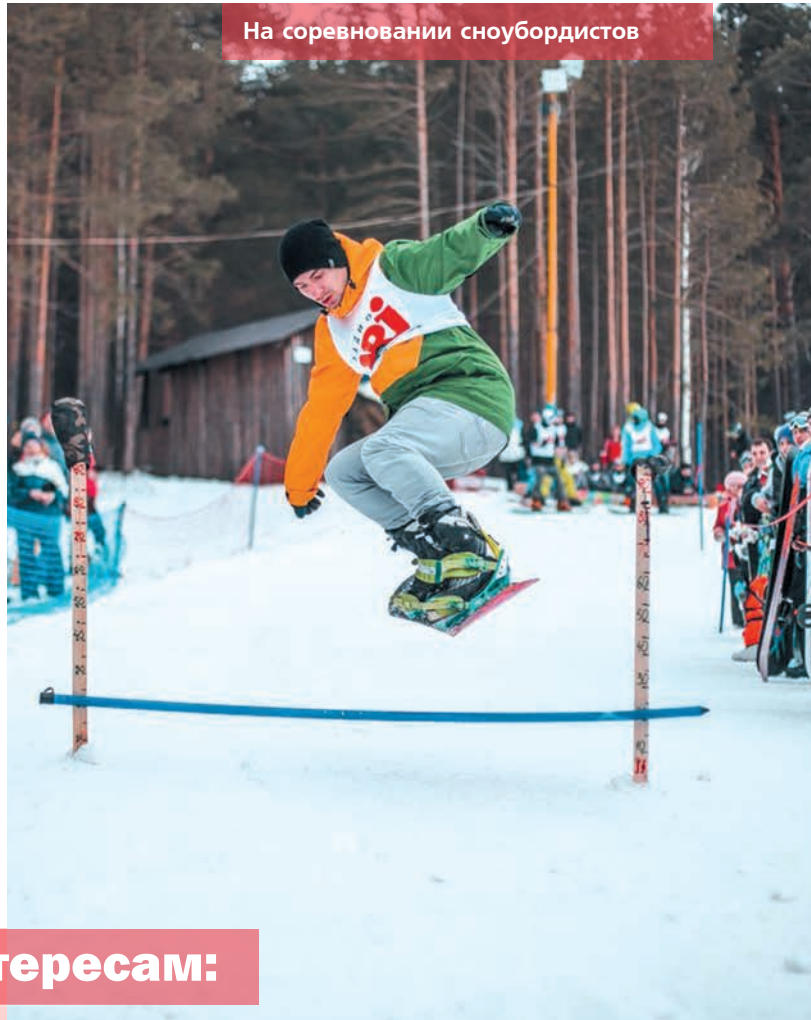
На соревнованиях сноубордистов