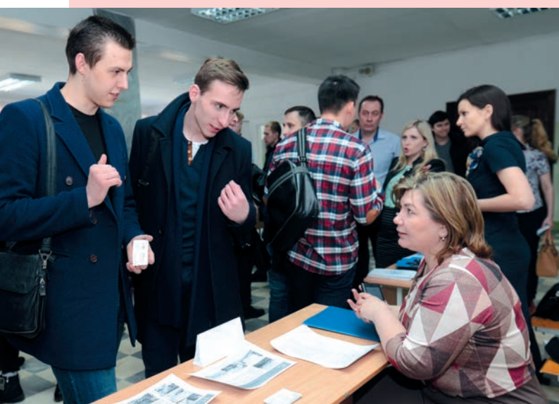
Уральская горнопромышленная декада — 2019. Ярмарка студентов

В рамках декады проходит Ярмарка студентов , в которой принимают участие старшекурсники. Подобрать квалифицированные инженерные кадры на постоянную работу со студенческой скамьи приезжают представители различных предприятий и крупных компаний, и будущие молодые специалисты имеют возможность из первых уст узнать об условиях и социальных пакетах, которые гарантируют работодатели.