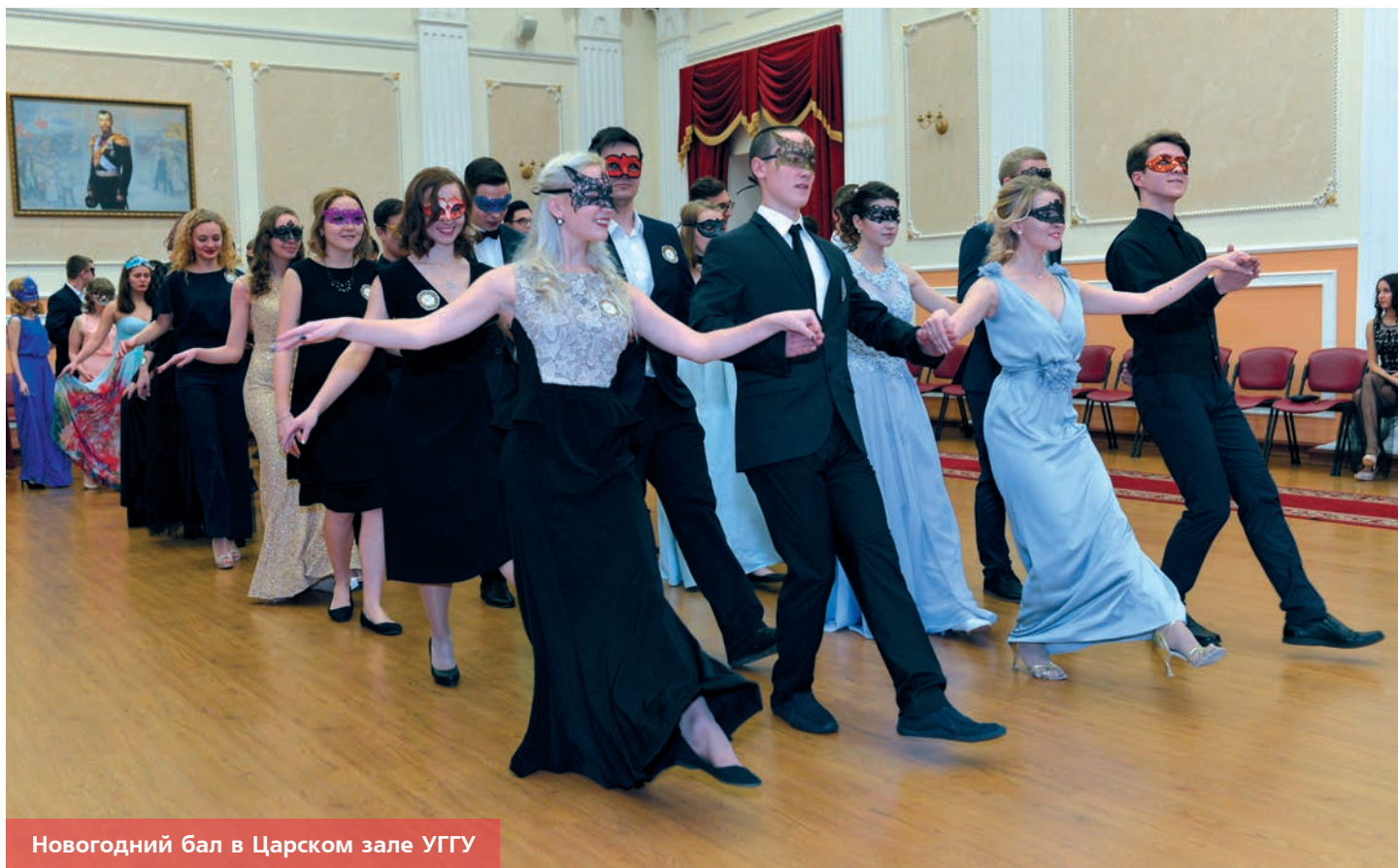
Новогодний бал в Царском зале УГГУ