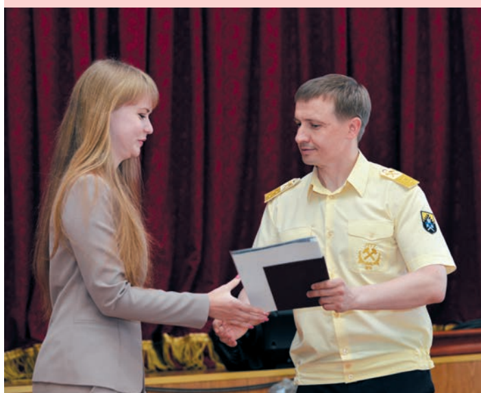
Ректор вручает дипломы новоиспеченным магистрам