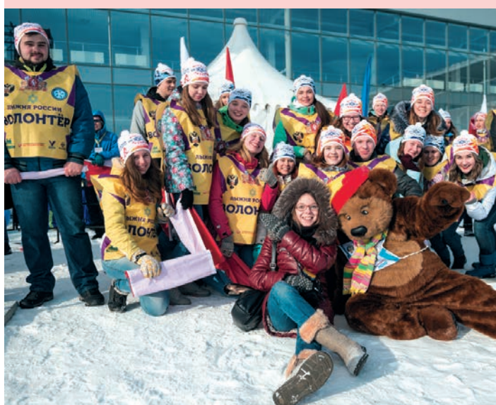
Участники «Лыжня России—2019»

В феврале встаем на лыжи. Студенты и преподаватели Горного университета принимают активное участие в традиционном спортивном празднике «Лыжня России» и каждый год входят в число лидеров соревнования. Горняки готовят для гостей и участников праздника развлекательную программу: открывают свой тир, где можно пострелять из страйкбольного оружия; организуют выставки Геологического музея, выступают на сцене с творческими номерами.