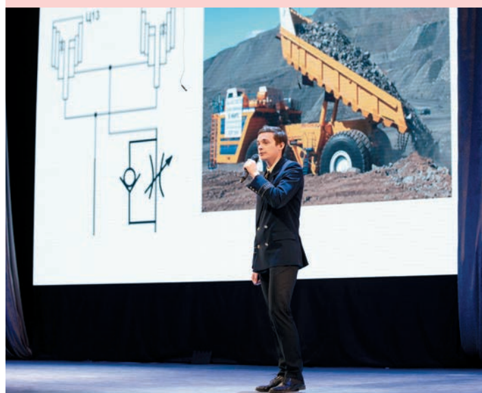
Студенты презентуют работодателям свои проекты