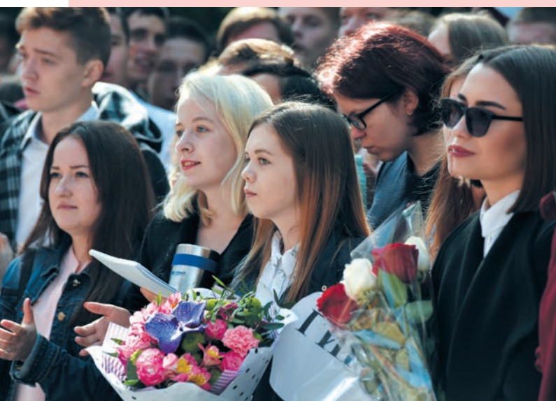
Первокурсники на торжественной линейке

В течение недели студенты знакомятся с научной библиотекой и Уральским геологическим музеем, посещают Храм горняков и значимые места Екатеринбурга, а также успевают побывать в театре и реализовать с помощью кураторов собственные социальные проекты.